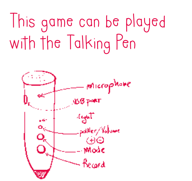
Diagram of the Talking Pen device.